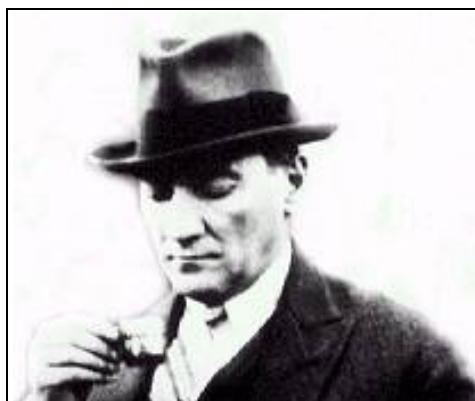
Kemal Atatürk schuf die laizistische Türkei, den Alewiten gab er die religiöse Gleichberechtigung und sicherte sich damit ihre politische Unterstützung