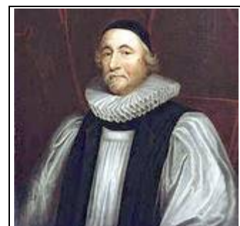
James Ussher: er positionierte das Schöpfungsdatum auf den 23. Oktober 4004 v.u.Z.

Junge-Erde-Kreationisten glauben, dass das Leben auf der Erde von Gott im Verlauf von 6 Schöpfungstagen zu je 24 Stunden in Form von Grundtypen bzw. definierten Arten ("nach ihrer Art") geschaffen wurde. Sie glauben auch, dass der biblische Bericht der Sintflut historisch wahr ist, und dass eine weltweite Flut vor ca. 4500 Jahren alles Leben auf der Erde vernichtet hat, abgesehen von den Lebewesen, die in der Arche Noah gerettet wurden.