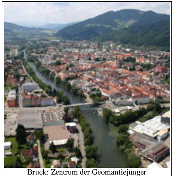
Bruck: Zentrum der Geomantiejongler

Das klingt nach einer Botschaft für die klassische Kerngruppe der Esoteriker: Eine urbane Mittelschicht, die sich irgendwie alternativ wähnt. Nur, die ist in der Obersteiermark unterrepräsentiert. Auch wenn seit den 80ern jeder zweite Industriearbeitsplatz verloren ging, die Arbeiterschaft ist hier nach wie vor die stärkste soziale Schicht, wie auch die Wahlergebnisse zeigen.