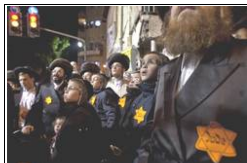
Ultraorthodoxe Juden haben sich bei einer Demo Judensterne angesteckt

Die in den Bussen sitzenden Ultraorthodoxen reagierten nicht, es gab keine Zwischenfälle. In Jerusalem zum Beispiel gibt es direkt am Jaffa-Tor zur Altstadt ein großes, unterirdisches Parkhaus, das von der Stadt betrieben wird. Am Schabbat bleibt das Parkhaus zu, während Tausende von Israelis, die es mit ihren Familien in die Altstadt zieht, verzweifelt nach einem Parkplatz suchen. Sie drehen dann Runde um Runde, um schließlich, völlig entnervt, ihre Autos irgendwo abzustellen, womit sie das Verkehrschaos nur noch weiter verstärken.