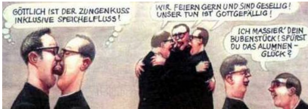
Ausschnitt aus der Falter-Karikatur

Krenn hatte probiert, die Affäre als "Bubendummheiten" ohne sexuellen Hintergründen darzustellen. Was Deix zu zwei bösen Karikaturen veranlasst