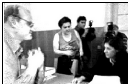
der theologische Kleinkindersexbilderfreund vor der Richterin mit dem ordentlichen Lebenswandel