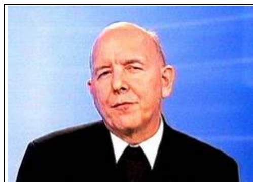
Opus Dei-Bischof Küng

Die katholische Kirche, die sich selbst ständig als moralische Instanz inszeniert, hat mit ihrem mehr als merkwürdigen Verhältnis zur menschlichen Sexualität, wieder einmal Gelegenheit, den Balken im eigenen Auge unter Betracht zu nehmen.