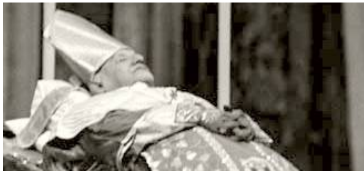
Der einbalsamierte Leichnam von Papst Johannes XXIII.

Der Vatikan erwartet am Pfingstsonntag einen Ansturm von Gläubigen. Die erstaunlich gut erhaltene Leiche von Papst Johannes XXIII. wird in einen gläsernen Sarkophag umgebettet.