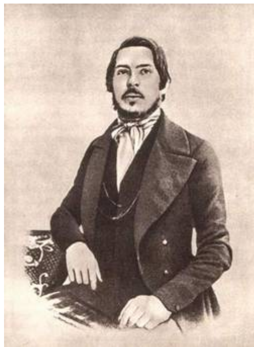
Karl Heinrich Marx (1818-1883) und Friedrich Engels (1820-1895) waren Gesellschaftstheoretiker, materialistische Philosophen, Theoretiker des Sozialismus und Kommunismus - die beiden Bilder sind typische marxistische Heiligenbilder ..

Ich weiß es, weil ich suchte ja auch mit. Die biedere kleinbürgerliche Welt der 1960-er-Jahre, mit ihren betulichen Wertvorgaben, ihrem verlogenen Gefrömmel und ihrer Vorgestrigkeit gingen mir auf den Wecker. Das konnte doch nicht alles sein. 1966 oder 1967 begann ich Marx zu lesen und war davon fasziniert, die Welt, die Gesellschaft materiell erklärt zu bekommen, also zu lernen, dass es nicht das Wort ist, das die Gesellschaft formt, sondern dass die Ökonomie den Unterbau bewirkt und das Wort maximal im gesellschaftlichen Überbau eine gewisse Rolle