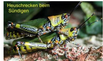
Heuschrecken beim Sündigen

9, 1-21 Und der fünfte Engel blies seine Posaune; und ich sah einen Stern, gefallen vom Himmel auf die Erde; und ihm wurde der Schlüssel zum Brunnen des Abgrunds gegeben. 2 Und er tat den Brunnen des Abgrunds auf, und es stieg auf ein Rauch aus dem Brunnen wie der Rauch eines großen Ofens, und es wurden verfinstert die Sonne und die Luft von dem Rauch des Brunnens. 3 Und aus dem Rauch kamen Heuschrecken auf die Erde, und ihnen wurde Macht gegeben, wie die Skorpione auf Erden Macht haben.