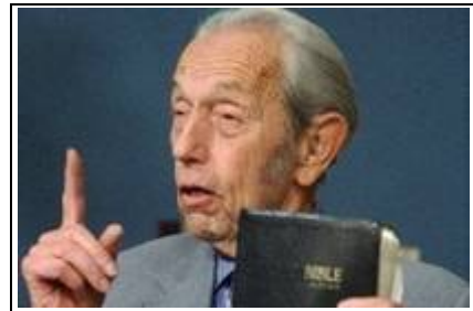
Prophet Harold Camping

Hier ein paar Auszüge aus diesem Bibelwerk - versehen mit gerahmten lehrreichen Erläuterungen.