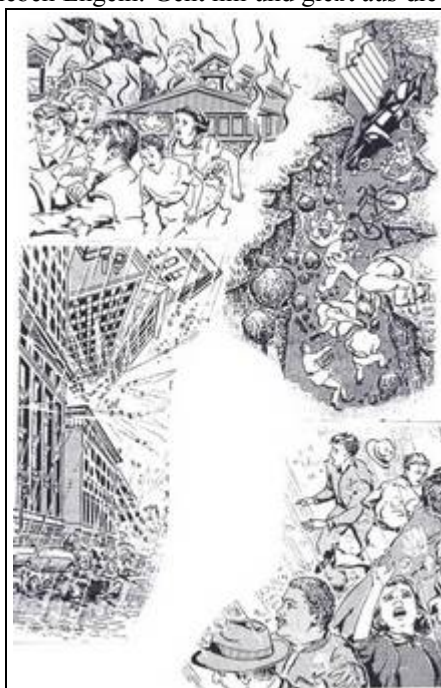
Harmagedon in einem Buch der Zeugen Jehovas