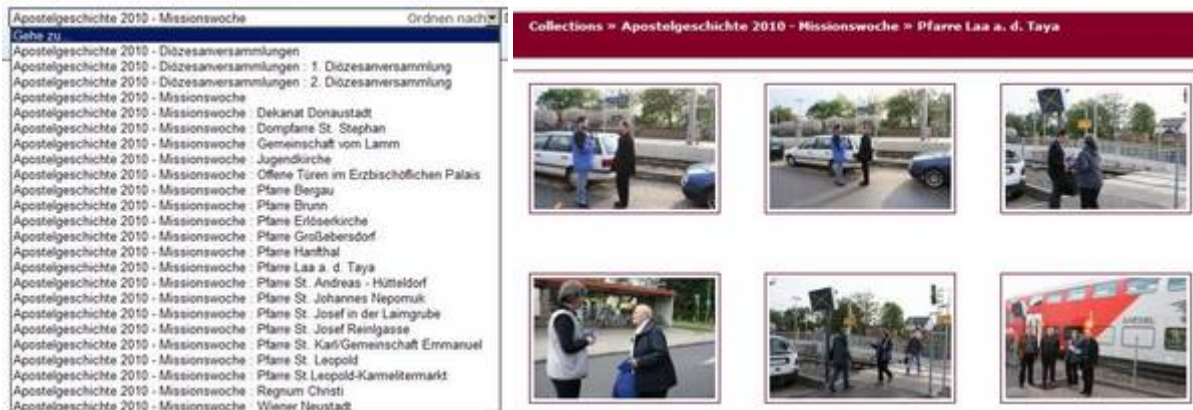
links die gesamte Liste der Berichte, rechts ein Auszug (3 Bilder wurden hier weggelassen) aus dem Bericht der Pfarre Laa a.d.Taya

mindest förderte die Nachschau nichts mehr zutage). Damals waren von den 660 Pfarren der Diözese lediglich zwanzig Berichte für die Homepage eingelangt, die gelieferten Bilder zeigten meist einige Leute, die Passanten irgendwelche Flugblätter anboten, wie man damals auf apg2010.at sehen konnte.