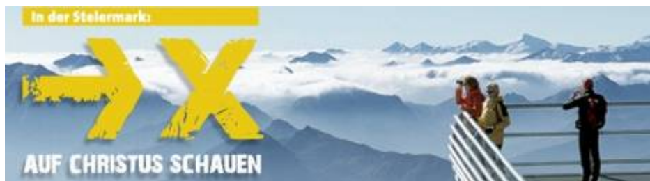
Banner der Christus-Schauen-Homepage

Im Oktober 2010 startete die katholische Kirche in der Steiermark landesweit eine Aktion an verschiedensten Stellen, Straßen, Plätzen Pfeile und X-e. in Zusammenarbeit von Straßenmeistereien, Polizei, Feuerwehren auf den Boden zu malen. "Auf Christus schauen", hieß diese quasi staatlich-katholische Aktion. Das "x" stand für "Christus" (man kennt das ja aus dem DEnglischen: "Xmas") und wo irgendwo ein Jesus hängt, sitzt, steht, fliegt, dort zeigt ein Pfeil auf ihn. Auf dass die dem Christentum allzu sehr entfremdeten Bürger wieder ihren HERRn Gott wahrnehmen mögen, den sie nach katholischer Wahrnehmung viel zu sehr ignorieren.