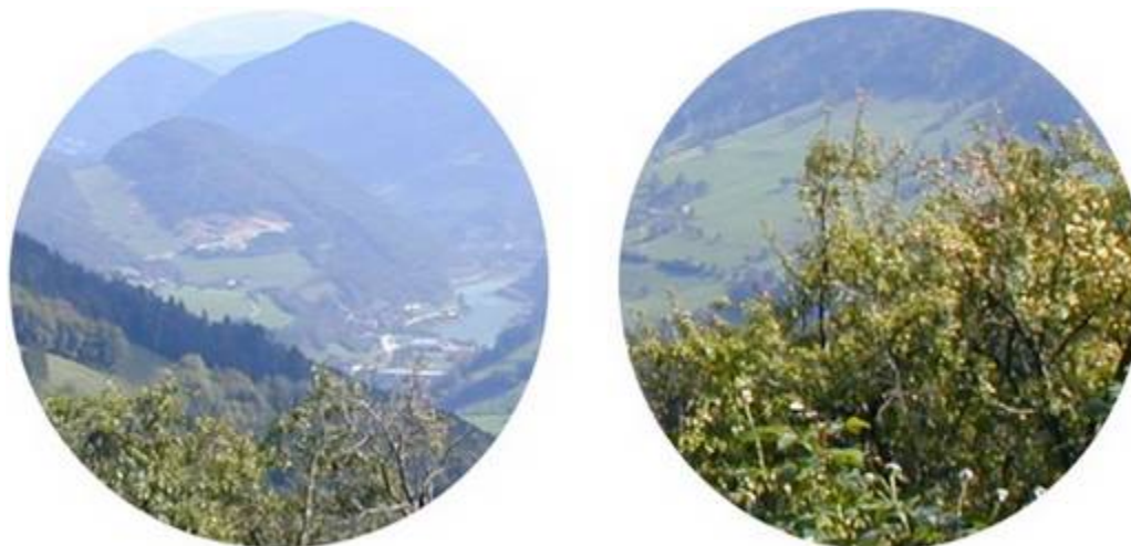
wir schauen hinaus

Fast genauso ist es mit unserer Wahrnehmung des Seins und des Bewusstseins. Wir sind zuerst einmal, wir nehmen uns selber wahr, unser subjektives Bewusstsein ist das Zentrum der Welt. Das Sein außerhalb nehmen wir wahr, das sind wir aber nicht. Für jeden von uns dreht sich die Welt um die eigene Person, wir sind die Sonne, die Wahrheit, das Leben und das Einzige, das ganz sicher wirklich existiert. Zwar alles recht trügerisch, aber wir erleben es so.