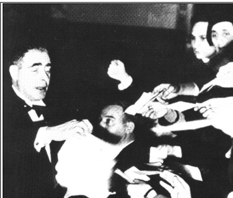
Steinschneider-Hanussen nimmt von seinem Publikum die Kuverts zum beschriebenen Trick entgegen.

Jetzt riss Hanussen das verschlossene Kuvert auf und las den Text laut vor. Das Publikum klatschte begeistert Beifall. Es ahnte nicht, dass Hanussen einen anderen Umschlag aufriss und eine Frage las, die ein anderer gestellt hatte. Während er die Frage ins Parkett rief, die dem vereinbarten Trick entsprach, las er für sich einen Text, von dem er erst nach seinem »Hellsehen« hätte Kenntnis nehmen dürfen. Und nun fragte er ins Publikum: »Wer hat das Kuvert "Magdeburg 39117" heraufgereicht?« Ein Mann erhob sich. Und Hanussen wiederholte seine Tranceposen. Und schilderte den »Fall« und die Frage, die sich an ihn knüpfte. Und wieder bestätigte der Mann aus dem Publikum - gutgläubig, nicht ahnend, dass er einem Trick erlag - die Frage und Hanussens Schilderung. Das Publikum tobte. Und so »löste« Hanussen jede Frage, indem er immer mit einem Kuvert voraus war.