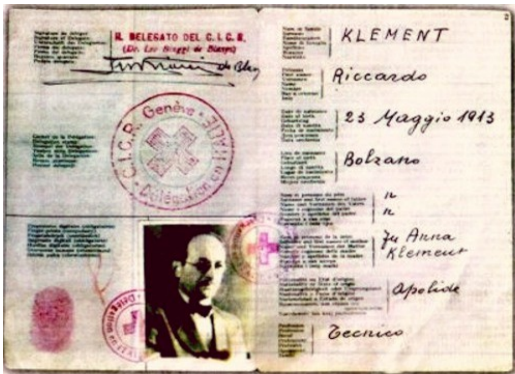
im Frühjahr 2007 wurde in Argentinien Eichmanns falscher Pass wieder entdeckt, für ihn hatten die Fluchthelfer einen Südtiroler namens "Riccardo Klement" erfunden

Wichtigste Zielländer der Rattenlinie Hudals waren Argentinien, Brasilien, Spanien, Ägypten und Syrien. Über diese Fluchtroute flüchteten u.a. Adolf Eichmann, Leiter des Judenreferates im RSHA, Franz Stangl KZ-Kommandant von Treblinka, KZ-Arzt Josef Mengele, Ante Pavelic, Führer des faschistischen Kroatien. Zeitweise wurde ihm sogar nachgesagt, er habe Martin Bormann zur Flucht nach Südamerika verholfen, was sich aber als falsch erwies, Bormann ist mit hoher Sicherheit 1945 in Berlin zu Tode gekommen. Vermutet wurde auch, dass Gestapo-Chef Heinrich Müller unter den Geflüchteten gewesen sein könnte, doch das blieb unnachweisbar, Müller gilt seit 1945 als verschollen. Zur Finanzierung der Aktionen konnten Bestände der Pfundfälschungen der Nazis, ("Aktion Bernhard") und Mittel aus dem "SS-Schatz" Verwendung finden. Bis 50.000 Nazis dürften sich mit Hudals und des Vatikan Hilfe einem Zugriff der Alliierten und der Nachkriegsbehörden entzogen haben.