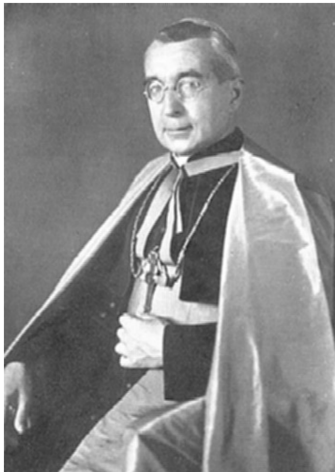
Bischof Alois C. Hudal - Träger des Goldenen Parteiabzeichens der NSDAP - ein "Komplize nach der Tat", der niemals zur Verantwortung gezogen wurde