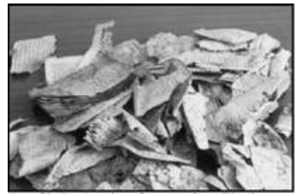
Some of the Quranic parchment fragments in the condition they were found.

Die Koranfragmente des Kalifen Al-Walid (v. 705-715), Abd al-Maliks Sohnes, wurden im Jahr 1972 in Jemen, in der Moschee von Sanaa mitsamt den überhaupt ältesten Koranfragmenten entdeckt. Sie enthalten nun nicht nur orthographische Abweichungen im Rasm, sondern auch eine andere Anordnung der Suren, die die Richtigkeit entsprechender Angaben in der Literatur, vor allem im Kitab al-Fihrist des Ibn al-Nadim, verfasst gegen 987–988, bestätigen. 107