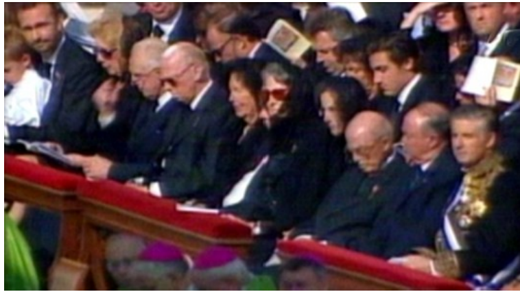
die abgetakelten Habsburger: seit dem letzten Karl keine Gnaden Gottes mehr!