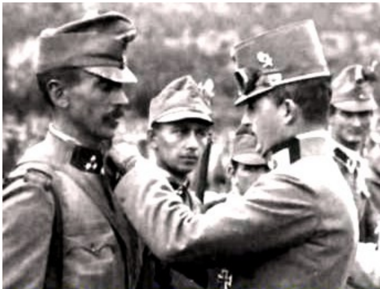
Karl benagelt Soldaten mit Orden

Kaiser Karl, der unter anderem den Einsatz von Giftgas im Ersten Weltkrieg anordnete, nach 1918 zweimal versuchte, in Ungarn durch Putsche an die Macht zu kommen und die Republik Österreich als unrechtmäßig ablehnte, ward jetzt durch die Anwesenheit des zweithöchsten Vertreters der Republik bei einer - zwar absurden - religiösen Zeremonie aufgewertet.