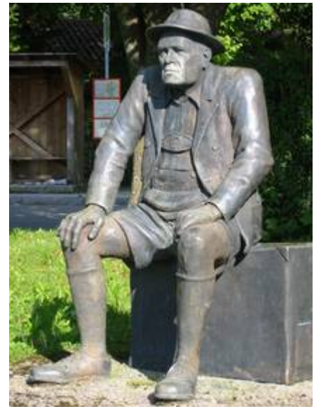
das Denkmal von Oskar Maria Graf in Aufkirchen

Und doch hatte ich mehrere tausend Seiten gelesen, die dieses Fleckchen Erde zum Universum machten. Diese Welt schien tatsächlich eine vom Himmel überwölbte Scheibe gewesen zu sein, deren Ränder nicht allzuweit entfernt lagen und nur deswegen unerreichbar dünkten, weil kein Bedarf dafür vorlag, soweit in die Welt hinaus zu wandern.