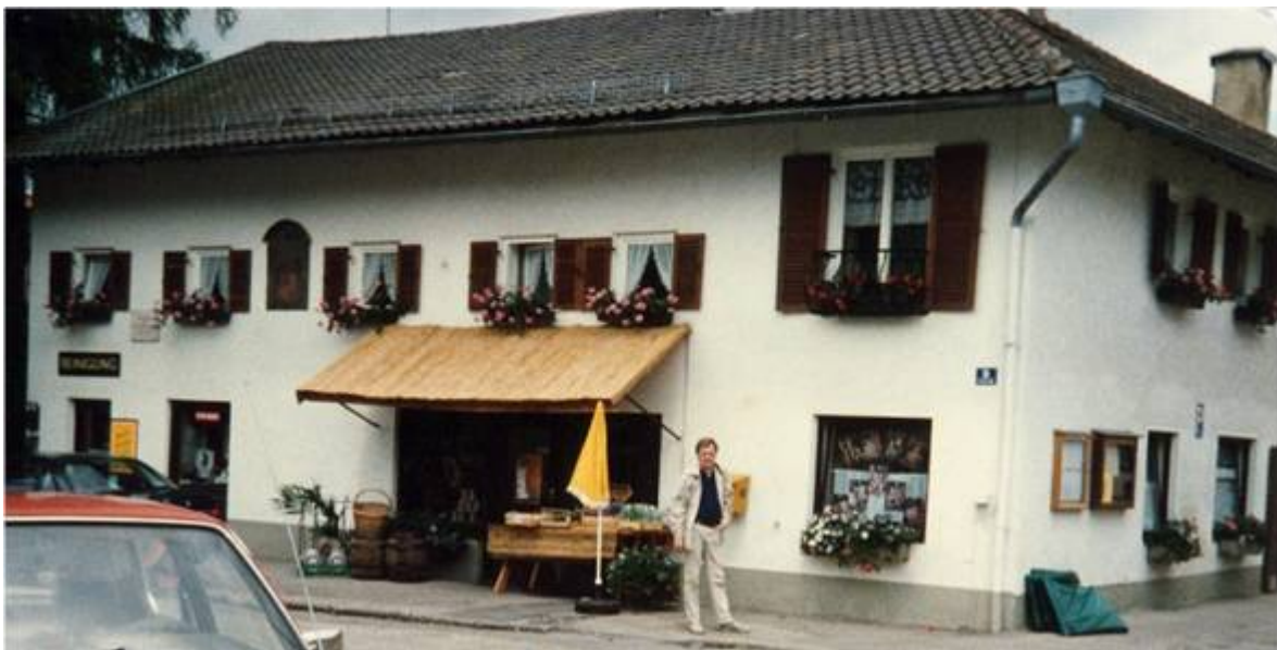
das Geburtshaus von Oskar Maria Graf

Graf selbst wanderte in die Welt hinaus, aber er fand sich dort eigentlich nie wirklich zurecht, seine Heimat blieb die bayrische Gegend um den Starnberger See aus der Zeit der Wende vom 19. zum 20. Jahrhundert. Diese Welt war für ihn später zwar örtlich, aber nicht mehr zeitlich erreichbar. Sie existierte nur noch in seinen Erzählungen. Der Qualitätsunterschied zwischen seinen "Geschichten vom Lande" und seinen "Geschichten aus der Stadt" belegt dies mehr als deutlich. Die Welt, die Graf örtlich und zeitlich hinter sich ließ, war sicherlich keine schöne und angenehme, er verklärte sie auch nicht als "gute, alte Zeit". Was man aus seinen Erzählungen und Romanen ablesen kann, ist, dass die Übersichtlichkeit, die Begrenztheit, die Beschränktheit dieser Welt, den Menschen eine wesentliche Grundlage für die Lebensorientierung bot.