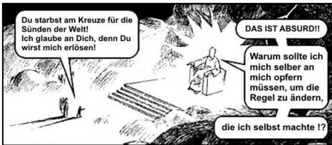
diese Zeichnung bringt die Absurdität der Christenlehre voll auf den Punkt